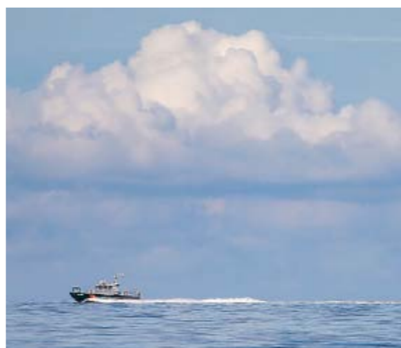
Pilvipoutainen sää hellii etsintä- ja pelastusharjoitusta lauantaina.

Merellä tapahtuvissa etsintätehtävissä viranomaisvastuu on rajavartiolaitoksella, maalla ja sisävesillä poliisilla.