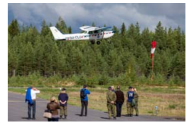
Ylivieskalainen Cessna 172 nousemassa ilmaan.