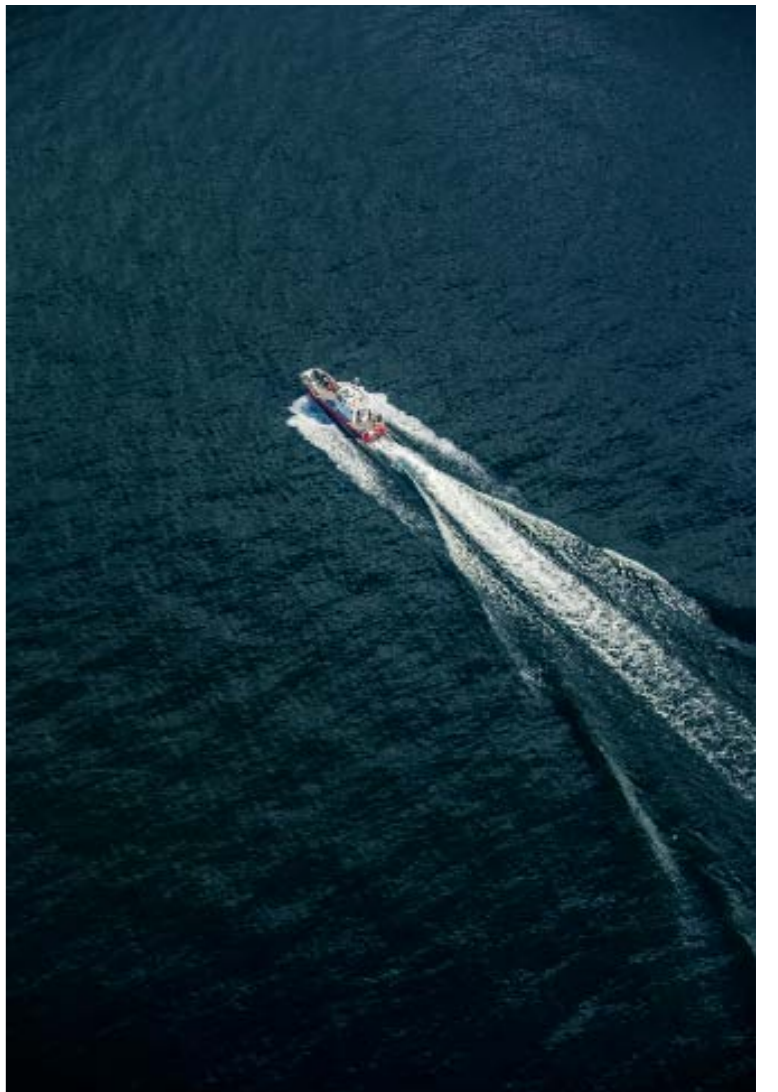
Laivassa täytyy mennä kannelle katsomaan, että lentokoneen merkit havaitsee kunnolla.

Vielä kun olisi haulikko ollut mukana, niin olisi päässyt sorsia pasailemaan.