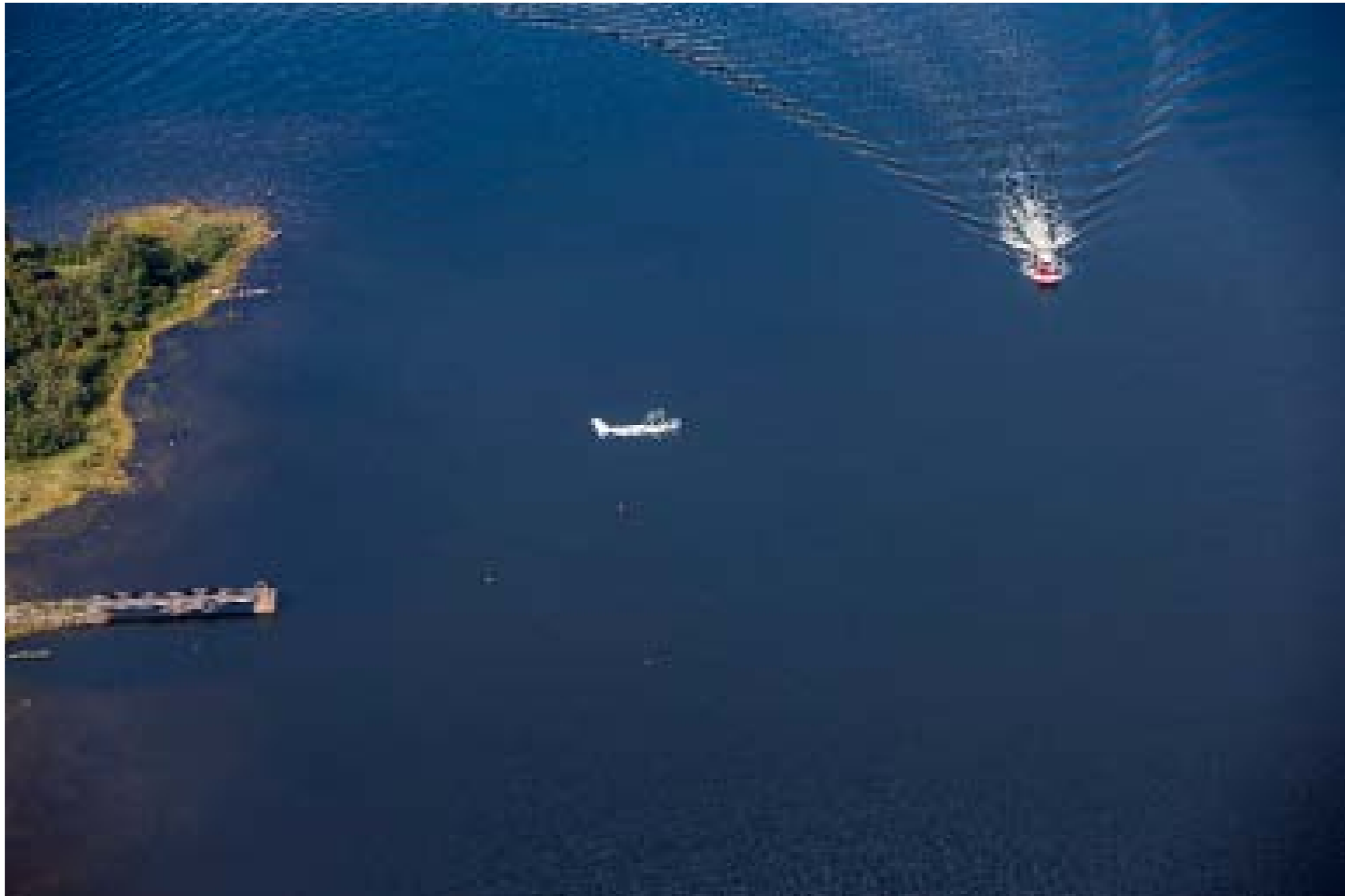
Maanpuolustuskoulutusyhdistyksen etsintä- ja pelastusharjoitus järjestettiin kuudetta kertaa. Tänä vuonna paikkana oli Raahen edustan merialueet sekä saaristo. Tavoitteena oli harjoitella lentokoneiden ja veneiden yhteistoimintaa. Pelastusväen ohella mukana oli puolustusvoimain muonituskurssilaisia ja vapaaehtoisia viestimiehiä harjoittelemassa viestiliikennettä.

Mukana oli kuusi pohjoisuumalaista pientä moottorikonetta Suomen Lentopelastusseuran kautta sekä viisi venettä Jokilaaksojen pe-